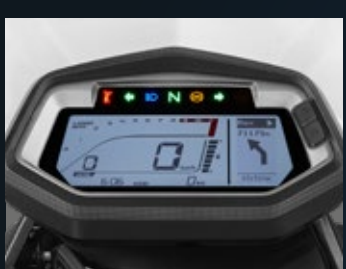
TABLERO DIGITAL CON NAVEGACIÓN GIRO A GIRO