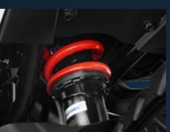
MONOSUSPENSIÓN AJUSTABLE A 10 POSICIONES